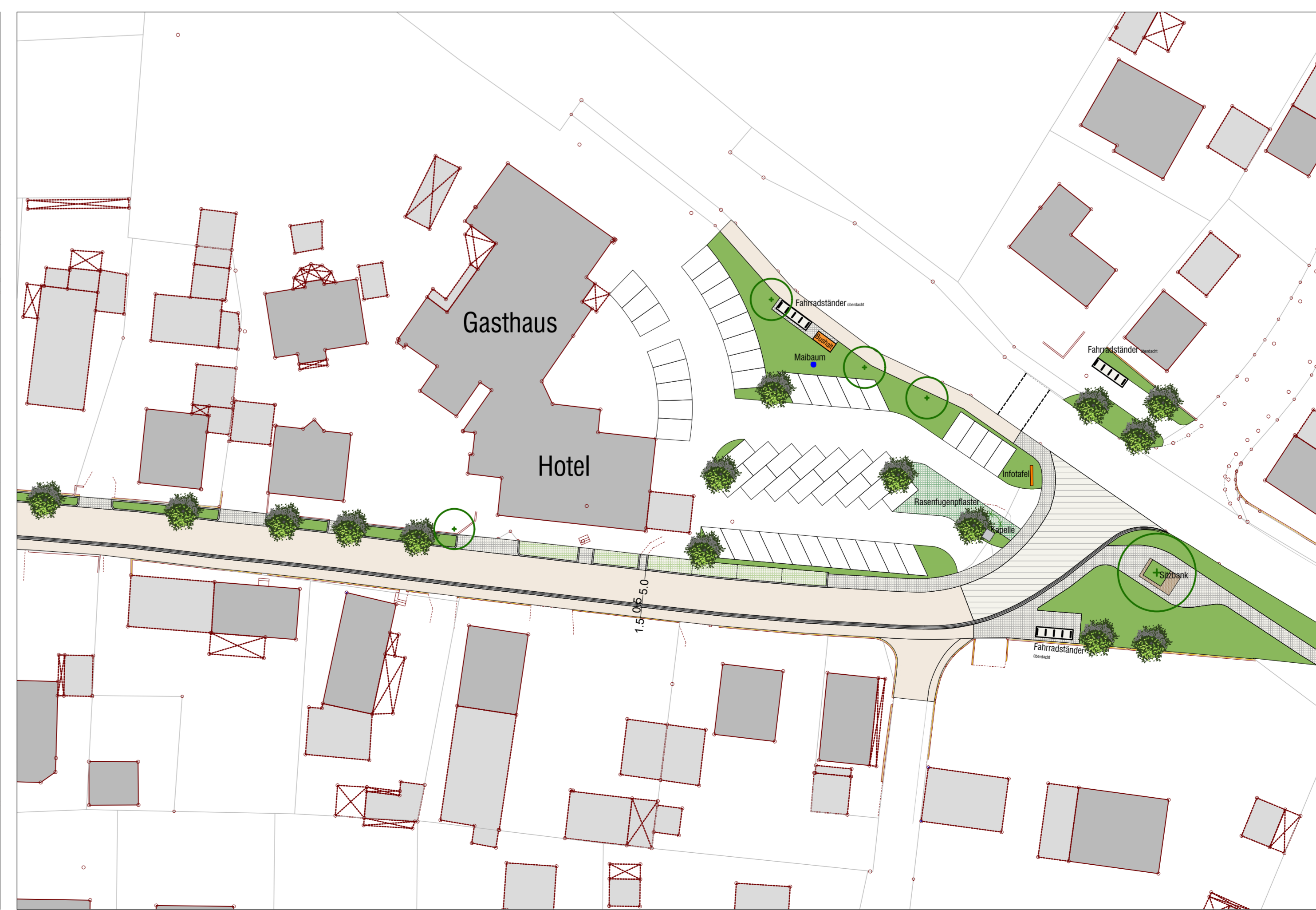
Vorplatz Platzer, M 1: 500